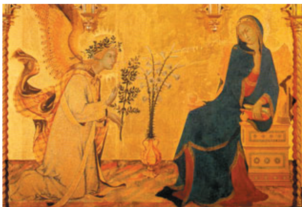
Simone di Martino. L'annonciation. 1333

me fait penser à l'Annonciation, faite à chacun de nous, qu'il est une promesse de deuxième naissance