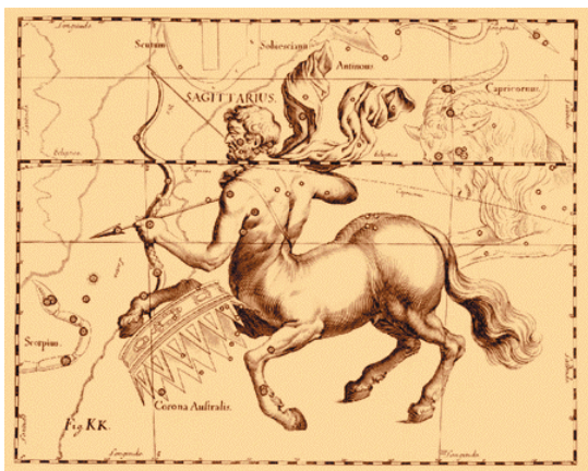
Atlas de Hevelius

Observer l'évolution de l'humanité, de la conscience, des sociétés... semble indubitablement générer petit à petit une passation de pouvoir : alors que pour tous, la vie incarnée commence par la vie animale et une réactualisation de tous les comportements, manières d'être et pulsions qui l'animent, il semble que l'évolution humaine, dont le développement du cortex humain et de la conscience de soi témoignent, nous invite à dépasser, à transcender les conditionnements psycho-biologiques de ce point de départ « animal »